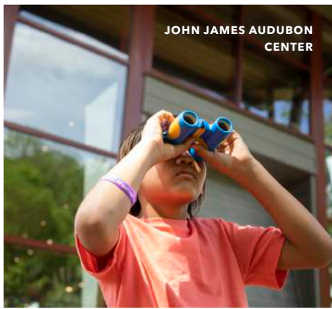
JOHN JAMES AUDUBON CENTER