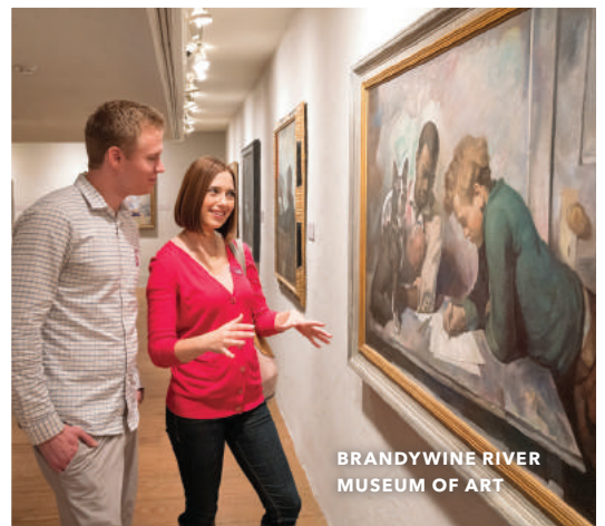
BRANDYWINE RIVER MUSEUM OF ART