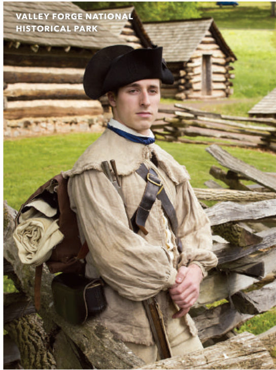
VALLEY FORGE NATIONAL HISTORICAL PARK