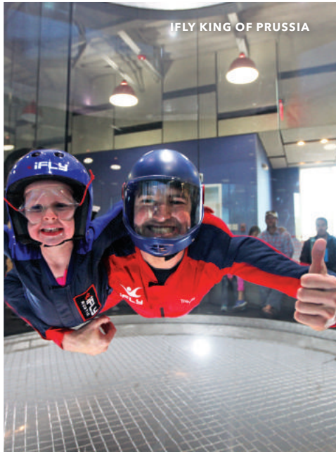
IFLY KING OF PRUSSIA

Wenn Sie nicht bereits ein paar Stunden oder Tage dafür eingeplant haben, ist es jetzt an der Zeit. Und hier ist Ihr Reiseziel: Egal ob mit Zug oder Auto, die Landschaft um Philadelphia hat ein eigenes Flair, das Sie bezaubern wird.