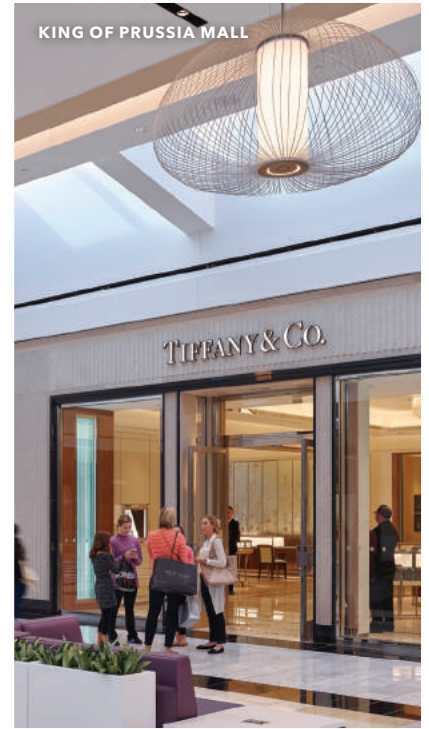
KING OF PRUSSIA MALL