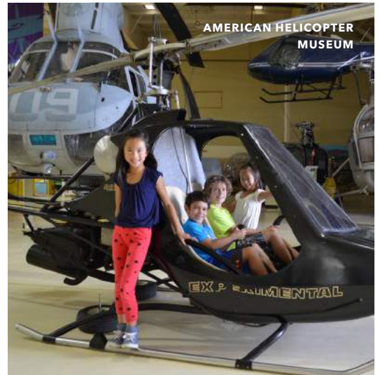
AMERICAN HELICOPTER MUSEUM