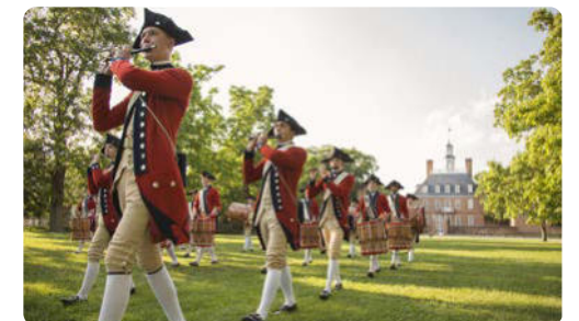
Fife and Drum Corps im kolonialen Williamsburg

Schwarzbären auf Ihrer 105 Meilen langen Fahrt entlang des Skyline Drives bis nach Front Royal.