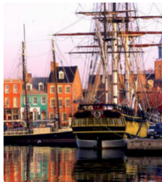
Fells Point, Baltimore

www.dcr.virginia.gov/state-parks/first-landing