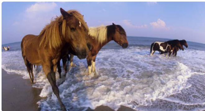
Assateague Island Ponies

Tag 3/4 > Die Historic National Road Scenic Byway führt Sie durch diesen Teil von Maryland und zu Ihrem nächsten Halt: Gambrill State Park. Dieser liegt in den Bergen der Catoctin Mountains in Frederick County. Genießen Sie einen atemberaubenden Bergblick von drei Aussichtspunkten sowie kilometerlange Wander-, Rad- und Reitwege. 75 Meilen bis zum Gambrill State Park ★ Weitere Sehenswürdigkeiten in der